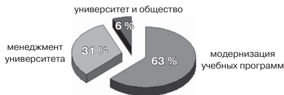
Рисунок 2. БГУ на конкурсах программы ТЕМПУС в 1994—2013 гг.