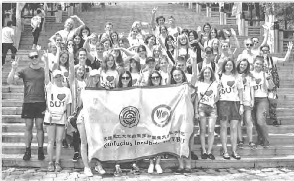
Участники летнего лингвистического лагеря

открытия Года образования Беларуси в Китае в январе 2019-го. Как отметил при этом А. Д. Король, «...сотрудничество в области образования является приоритетным направлением в укреплении и развитии взаимовыгодных отношений двух стран. В БГУ планируются реализация и организация ряда мероприятий, приуроченных к Году образования Беларуси в Китае. В число событий включены проведение китайско-белорусского молодёжного форума, Дня