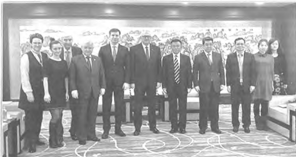
Белорусская и китайская делегации на церемонии открытия Года образования Беларуси в Китае

институтов Конфуция, летних школ для граждан КНР, организация исследований развития белорусско-китайских отношений» [3].