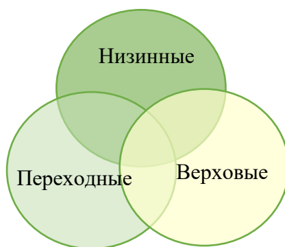
Рис. 2. Диаграмма Венна «Типы болот»

Примером отношения трех множеств может быть сравнение понятий верховые, низинные и переходные болота (рис. 2). С понятиями учащиеся знакомятся в 9 классе при изучении темы « Поверхностные воды. Реки, каналы, озёра, водохранилища и болота ».