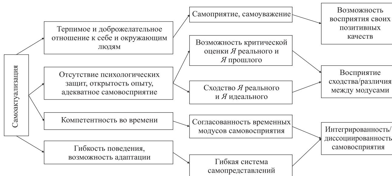
Рис. 1. Влияние самоактуализации на самовосприятие